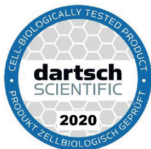
Prof. Dr. Peter C. Dartsch Diplom-Biochemiker

Auf den ersten Blick mögen die erhaltenen Werte zur Inaktivierung der Radikale und damit zur Entzündungshemmung mit knapp 10% nur gering sein. Berücksichtigt man jedoch, dass die Tests unmittelbar nach der 10-minütigen und einmaligen Vitalizer-Exposition durchgeführt wurden und auch die Zellen bis zur Durchführung der Messungen nur max. 5 Minuten für eine mögliche Aktivierung der intrazellulären Signalketten hatten, ist das Ergebnis außerordentlich bemerkenswert. Dieser rasche Wirkungseintritt in vitro könnte auch die schnell eintretende Schmerzlinderung und Verbesserung einer Entzündungsreaktion in vivo nach der Anwendung des Vitalizers erklären. Interessant und auch relevant für die Anwendung beim Menschen wäre eine zukünftige Untersuchung der Wirkung, nachdem diese Zellen an mehreren aufeinanderfolgenden Tagen mit dem Vitalizer behandelt wurden.